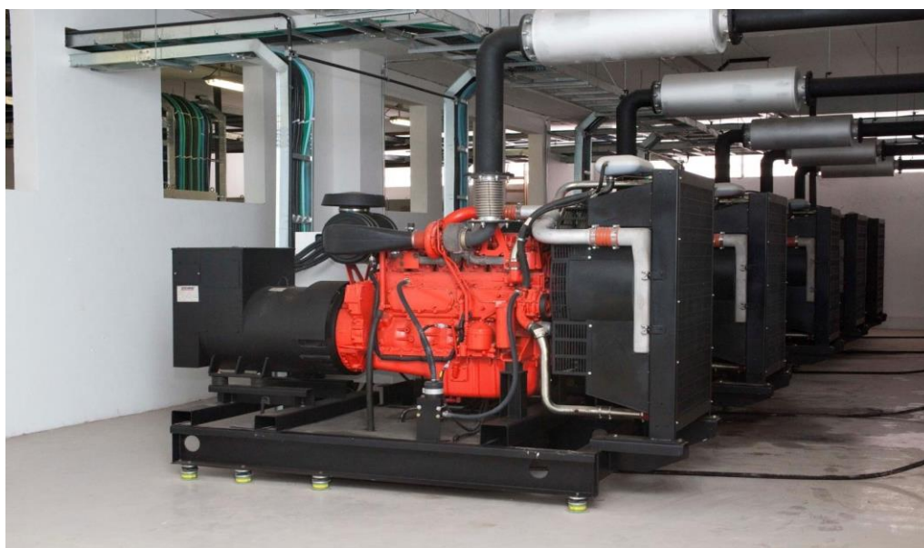
INSTITUTO BUTANTAN SÃO PAULO – FÁBRICA DE HEMODERIVADOS GRUPOS GERADORES