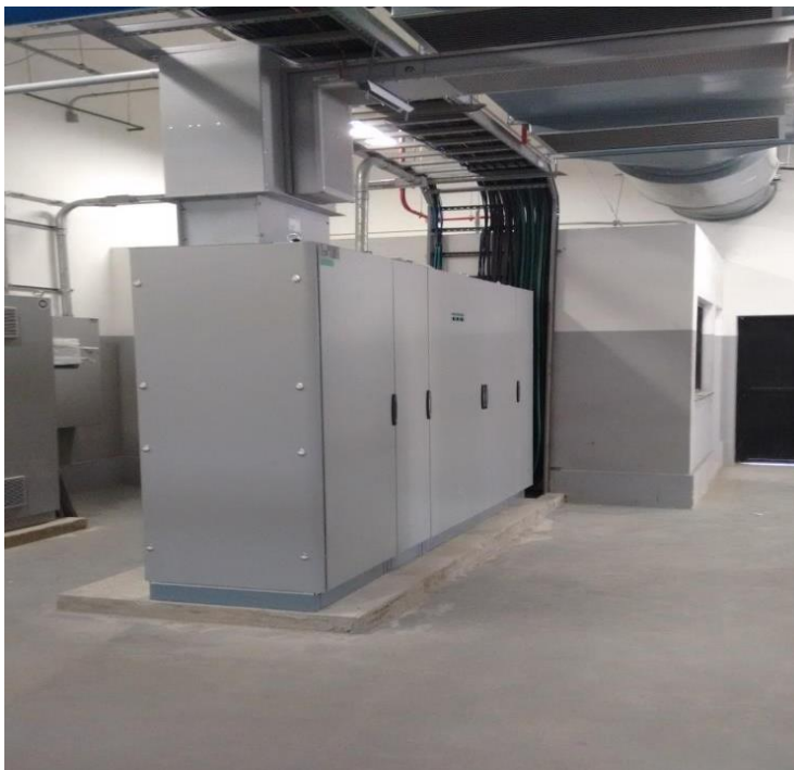
FUNDAÇÃO OSWALDO CRUZ RIO DE JANEIRO-CAG QUADRO GERAL DE DISTRIBUIÇÃO