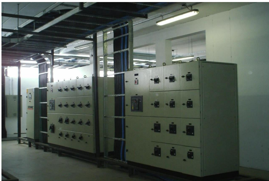
INSTITUTO BUTANTAN SÃO PAULO – FÁBRICA DE HEMODERIVADOS PAINEL GERAL DE DISTRIBUIÇÃO-QGBT;