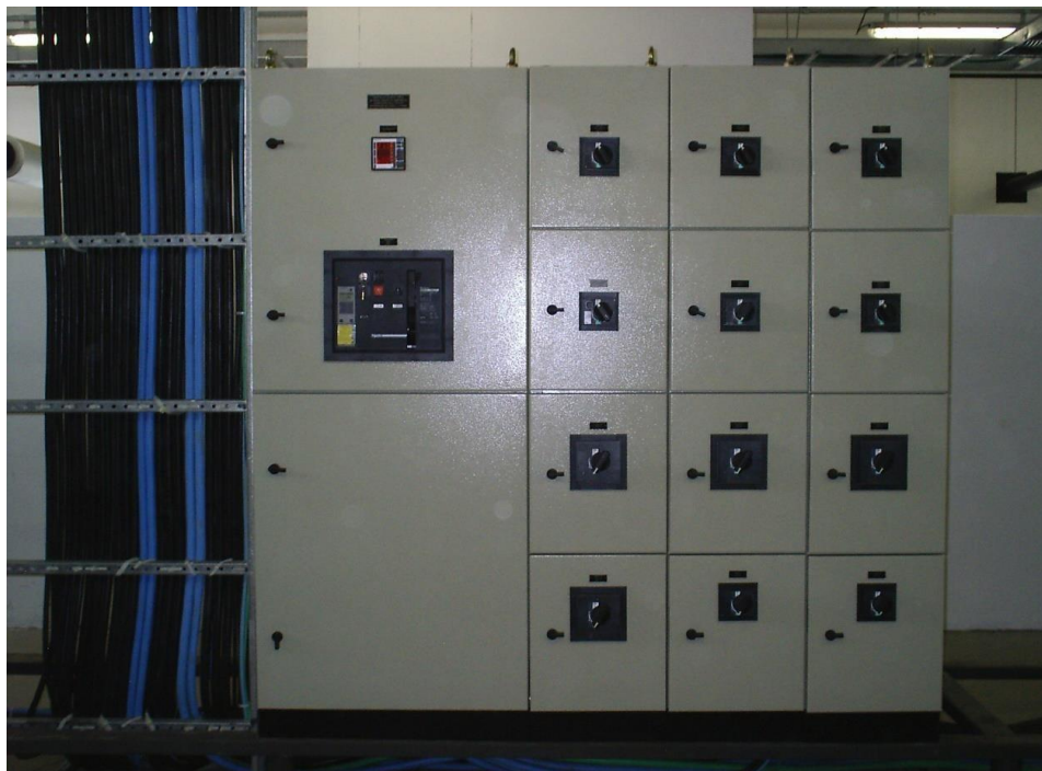
INSTITUTO BUTANTAN SÃO PAULO – FÁBRICA DE HEMODERIVADOS PAINEL GERAL DE DISTRIBUIÇÃO-QGBT;